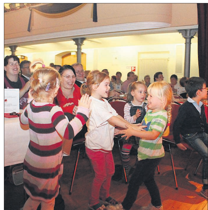
Fröhliches Kinderlachen. So soll es immer sein. Die Benefizveranstaltung hat dazu ihren Beitrag geleistet.